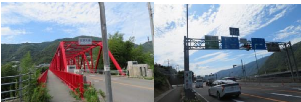
※三好大橋、阿波池田駅への路

⑦この駅から土讃線となり、明日のアクセスを考えての歩きとなる。14時23分、国道に合流する。14時26分、西井川小学校前を通過。真言宗御堂派秀磐山不動院前を通過。この寺の掲示を感動の余りメモする。「 持って行けぬか残して逝けるあなたの善意と行い 」この寺の前に、明日吉野川を渡る”三好大橋”（14時36分）があった。少し行った先にも国道32号に繋がる橋があった。15時12分、高層ビルの徳島県立三好病院があった。