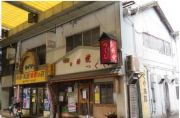
※ビジネスホテルヤマシロ、お好み焼き”つくし’