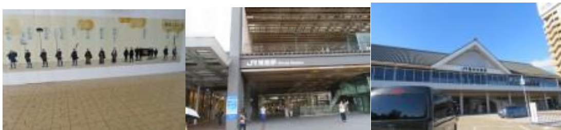
※みゆき通りにある参勤交代風景、姫路駅、播州赤穂駅

予定のダイヤより30分遅い電車（姫路発16時3分）で播州赤穂駅に向かう。この駅は、偶然にも1年前の8月7（金）、播州赤穂駅から相生駅まで（10.5 km）踏破の際、立ち寄った駅なので懐かしさが込み上げてきた。ホテルニュー