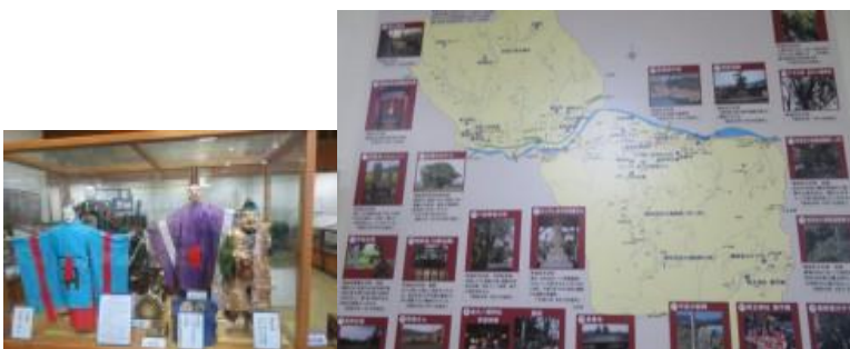
※歴史民俗資料館の鑑賞