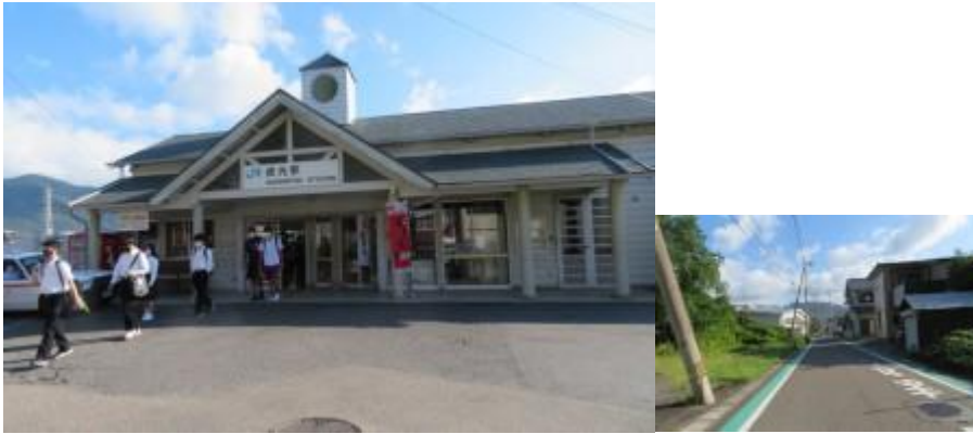
※貞光駅、阿波半田駅への路