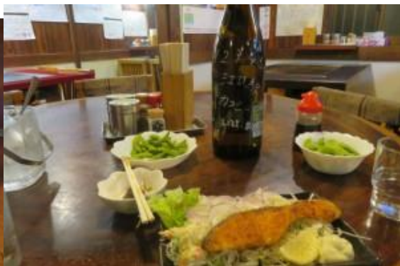
※鮎の差し入れ、焼酎1万2千345km突破記念！！