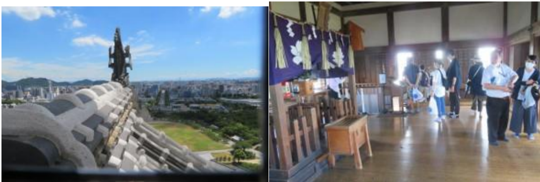
※天守閣からの眺め、刑部大明神