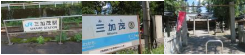
※三加茂駅、金丸八幡神社

④11時15分、78歩ある加茂谷橋を渡る。11時25分、少し早い阿麺房に立ち寄り”徳島ラーメン”を頂く。25分位休息。火照った体を癒してくれた。この店を出た先に香川に本店があるスーパー“マルナカ”があった。12時、阿波加茂駅に到着。