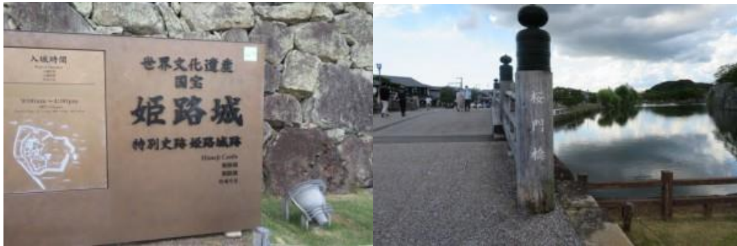
※姫路城看板、桜門橋

姫路城を2時位、ゆっくり鑑賞する。15時過ぎ、姫路城の前のミラノでかき氷を頂く。急な階段で火照った体を癒してくれた。みゆき通りを通り、姫路駅に向かう。