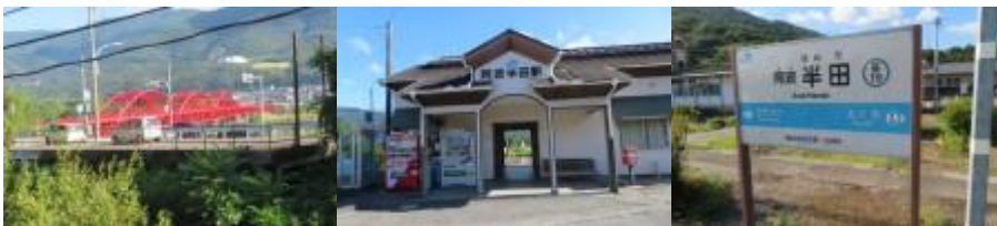
※美馬大橋、阿波半田駅

②8時23分、JR線跨ぎ、鉄道の右側となり、大きく回り込んで国道192号線に合流する。8時30分、143mある半田橋（半田川）を渡る。8時52分、徳島行き車両と対面する。9時5分、四国中央市47km、三好市19kmの道路標識前を通過。9時16分、つるぎ町から東みよし町に入る。この辺りで、ウォーキングを開始した2012年5月3日（水）から起算して、 通算営業キロ1万2千345km に到達する。この記録を祝ってくれるかのようにフラワーロードが続く。江口駅には10時到着。秋の訪れを感じる赤トンボが沢山駅周辺で見かける。丁度、阿波池田駅に向かって特急が通過して行く。