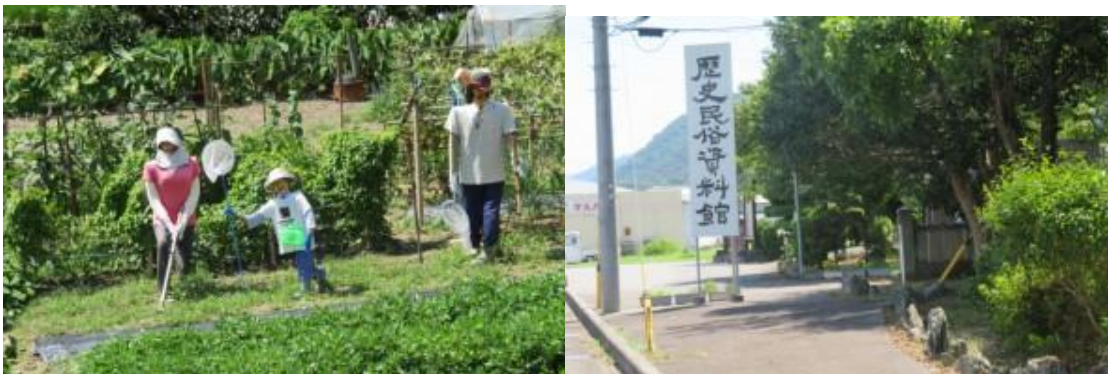
※動きそうな”かかし”、歴史民俗資料館

③10時8分、四国中央市（川之江）44 km、三好市（阿波池田）16 kmと記した道路標識前を通過。10時18分、城谷で今にも動きそうな”かかし”に感動。10時40分、歴史民俗資料館に立ち寄り東みよし町の文化財を15分位鑑賞する。目と鼻の先に三加茂駅（10時58分）があった。駅に面して金丸八幡神社があった。